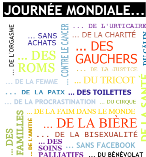
■ janvier ■ février ■ mars ■ avril ■ mai ■ juin ■ juillet ■ août ■ septembre ■ octobre ■ novembre ■ décembre Source : journee-mondiale.com Infographie LE FIGARO